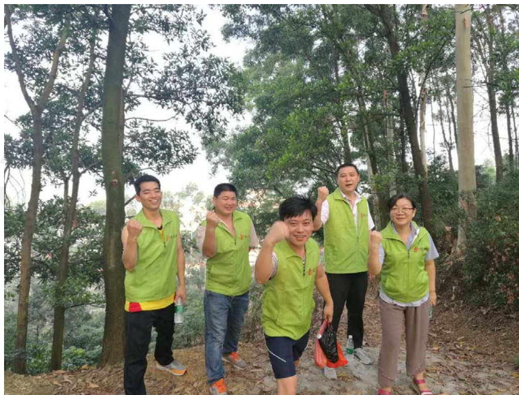
塘厦龙背岭村龙脊山